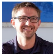
Steffen David IPB Internet Provider in Berlin GmbH