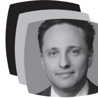
Ammar Alkassar Bevollmächtigter für Innovation und Strategie und CIO des Saarlandes