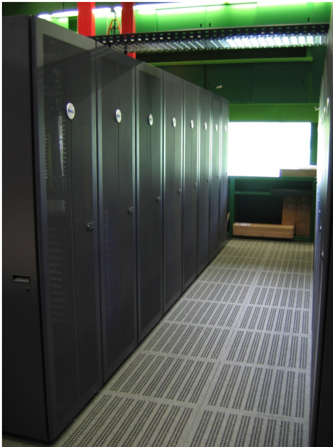
HPC-System Athene der Universität Regensburg