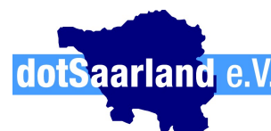
Dorothea Marx Öffentlichkeitsarbeit dotSaarland e.V.

Unter der Top-Level-Domain .SAARLAND eröffnet sich für Saarländer und Freunde des Saarlandes ein Raum zur Entfaltung der saarländischen Identität. SAARLAND können Unternehmen, Organisationen und Privatleute nutzen, um mit ihren Webseiten speziell das saarländische Publikum anzusprechen. Insbesondere regionale und lokale Firmen können ihr Profil so schon über die Internet-Endung schärfen und ihre Auffindbarkeit im Netz steigern.